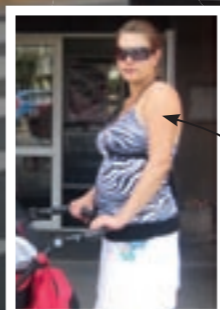
Ilyen voltam korábban